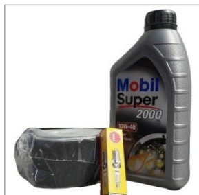
Zestaw serwisowy do silnika typu HONDA GX ...