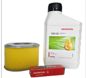
Zestaw serwisowy HONDA GX 160