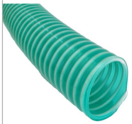
Wąż ssący PCV 2" / 50 mm