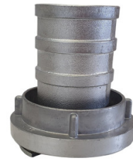
Łącznik ssawny 2"/3"