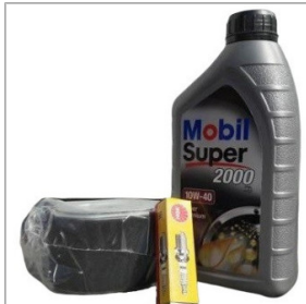
Zestaw serwisowy do silnika HONDA GX160