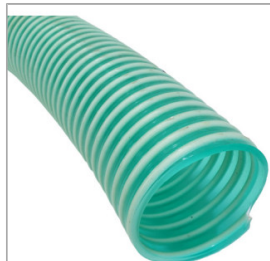
WĄŻ SSĄCY PCV 3" / 75 mm