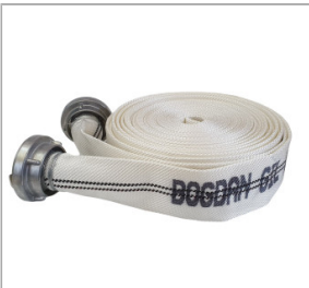
Wąż tłoczny strażacki 3" / 75 mm [dł. 20m]