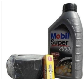
Zestaw serwisowy do silnika typu HONDA GX ...