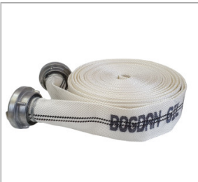
Wąż tłoczny strażacki 3" / 75 mm [dł. 20m]