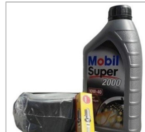
Zestaw serwisowy do silnika typu HONDA GX ...