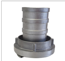
Łącznik ssawny 2"/3"