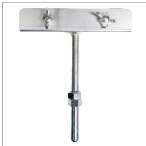
Siodło do listwy zgarniającej Jazon