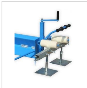
Części do łąty zgarniającej Jazon