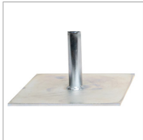
Stopa do listwy zgarniającej Jazon