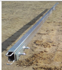
Szyna 3m do listwy zgarniającej Jazon