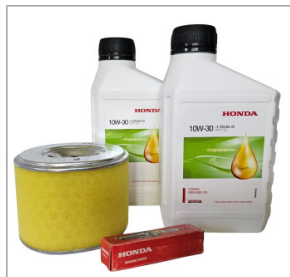
Zestaw serwisowy HONDA GX 390