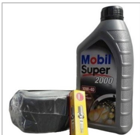
Zestaw serwisowy do silnika typu HONDA GX ...