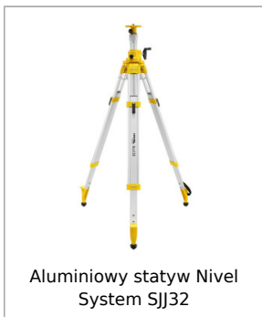
Aluminiowy statyw Nivel System SJJ32