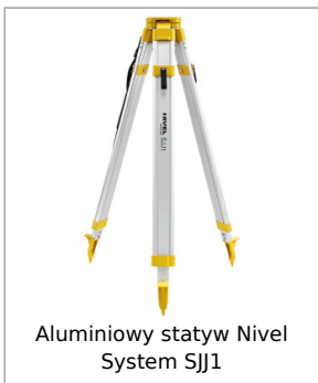
Aluminiowy statyw Nivel System SJJ1