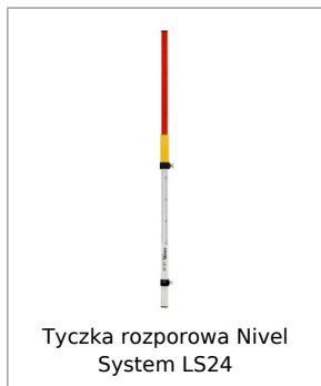
Tyczka rozporowa Nivel System LS24