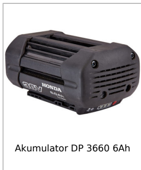
Akumulator DP 3660 6Ah