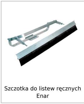
Szczotka do listew ręcznych Enar