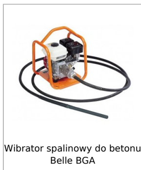
Wibrator spalinowy do betonu Belle BGA