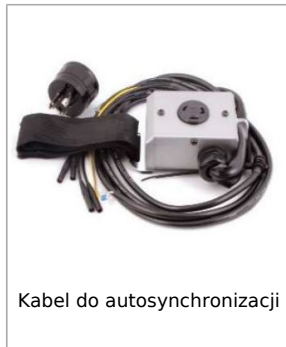
Kabel do autosynchronizacji