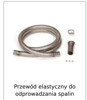
Przewód elastyczny do odprowadzania spalin