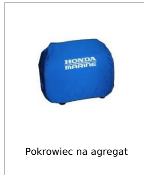
Pokrowiec na agregat