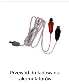
Przewód do ładowania akumulatorów