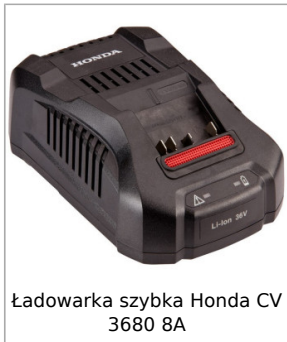
Ładowarka szybka Honda CV 3680 8A