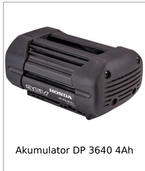
Akumulator DP 3640 4Ah