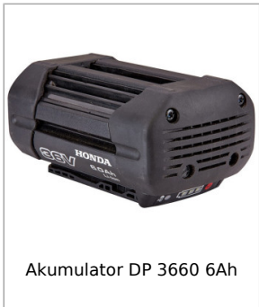
Akumulator DP 3660 6Ah