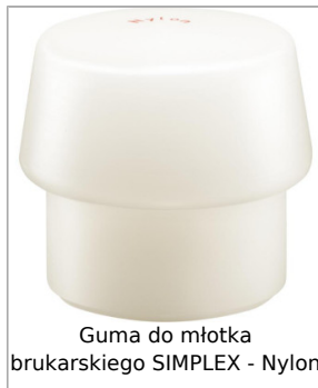
Guma do młotka brukarskiego SIMPLEX - Nylon