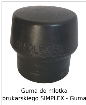
Guma do młotka brukarskiego SIMPLEX - Guma