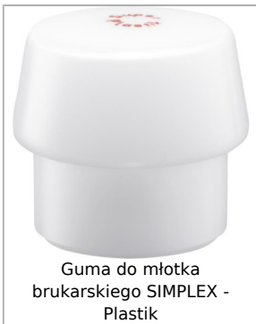
Guma do młotka brukarskiego SIMPLEX - Plastik