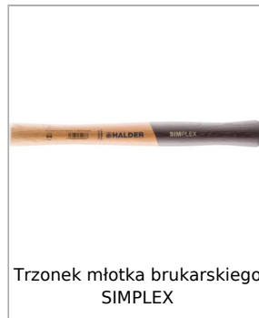
Trzonek młotka brukarskiego SIMPLEX