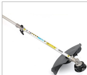
Wykaszarka - Głowica żyłkowa SSBC E