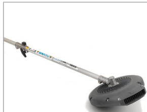
Dmuchawa SSBL E