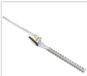
Nożyce do żywopłotu SSHE LE (długie)