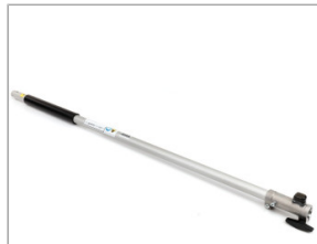
Przedłużka SSEE LE (100cm)