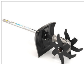
Glebogryzarka SSCL E