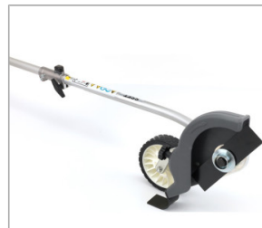
Krawędziarka SSET E