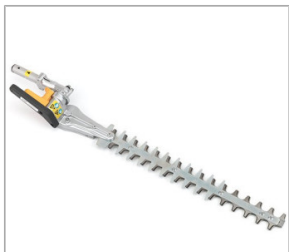
Nożyce do żywopłotu SSHE SE (krótkie)