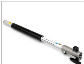
Przedłużka SSES SE (50cm)