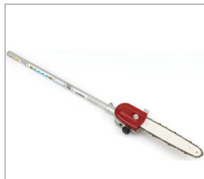
Podkrzesywarka SSPP E