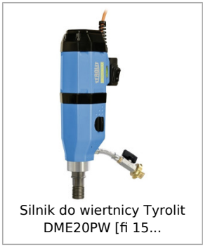
Silnik do wiertnicy Tyrolit DME20PW [fi 15...