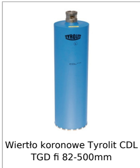
Wiertło koronowe Tyrolit CDL TGD fi 82-500mm