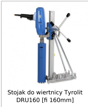
Stojak do wiertnicy Tyrolit DRU160 [fi 160mm]