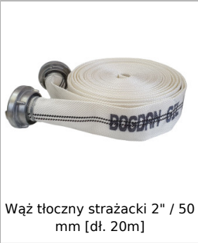
Wąż tłoczny strażacki 2" / 50 mm [dł. 20m]