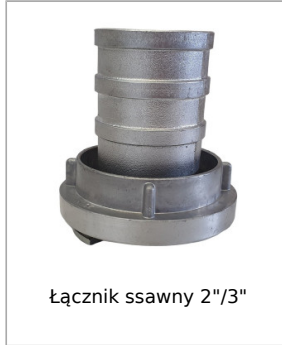
Łącznik ssawny 2"/3"