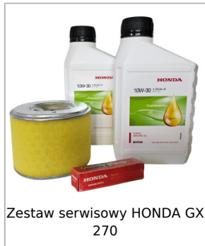
Zestaw serwisowy HONDA GX 270