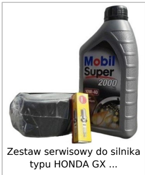
Zestaw serwisowy do silnika typu HONDA GX ...