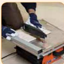
Lekka i kompaktowa