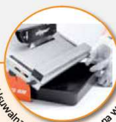
Usuwalna plastikowa miska na wodę.