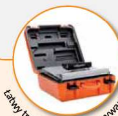
Łatwy transport i przechowywanie.