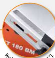
Pochylny blat (0° do 45°).