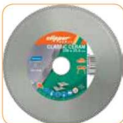
CLASSIC CERAM Ø 180 x 25,4 mm