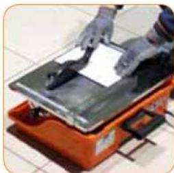
Prowadnica do cięcia