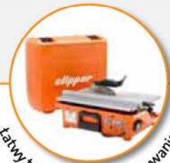
Łatwy transport i przechowywanie.