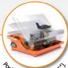
Pochylna głowka (0° to 45°).