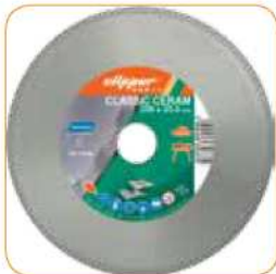
CLASSIC CERAM Ø 200 x 25,4 mm