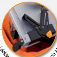
Szybka i dokładna prowadnica do cięcia z blokadą.