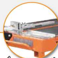
Prowadnica w zestawie