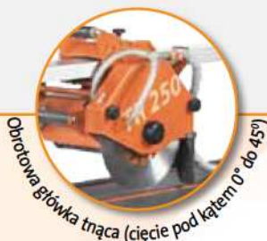
Obrotowa głowka tnąca (cięcie pod kątem 0° do 45°)

Bardzo czyste i precyzyjne cięcie Łatwy transport w miejscu budowy Ciągłe i optymalne chłodzenie tarczy Cięcie pod kątem 0° – 45° Regulacja głębokości cięcia Czyste stanowisko robocze i oszczędność wody Optymalne ułożenie ciętego materiału, również przy dużych formatach