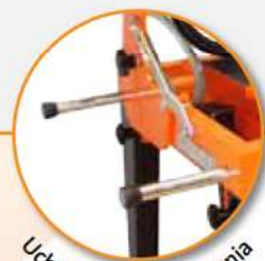
Uchwyty do przenoszenia