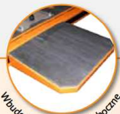
Wbudowane wydłużenie boczne