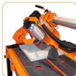
Pochylna głowica i szyna prowadząca